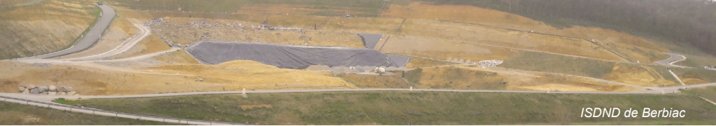
ISDND de Berbiac